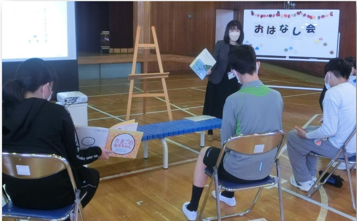
令和4年度 県立長生特別支援学校での読書支援の様子 (おはなし会の後、絵本の読み聞かせ講座を実施しました。)