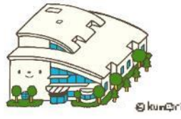
千葉県立東部図書館