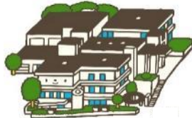
千葉県立中央図書館