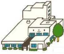
千葉県立西部図書館