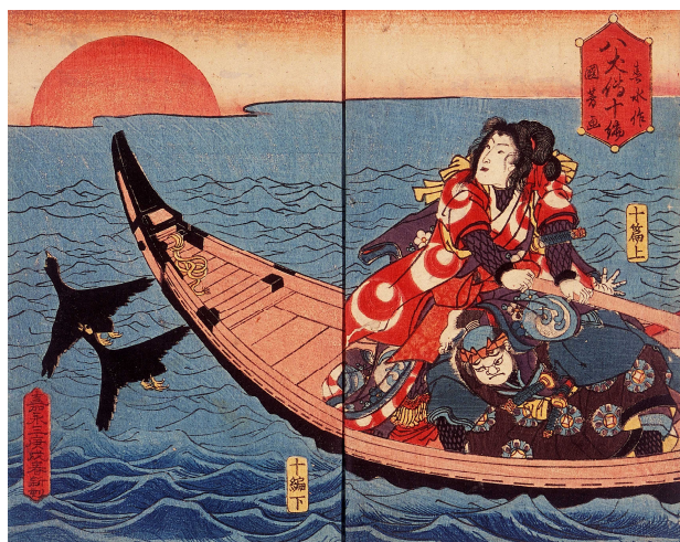
『仮名読八犬伝』為永春水(2代目)作、歌川国芳画ほか