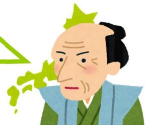
千葉県の偉人・伊能忠敬