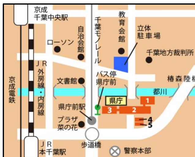
1: 千葉県本庁舎 (一番高い建物)