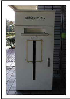
へんきやく ぽす と 返却ポスト