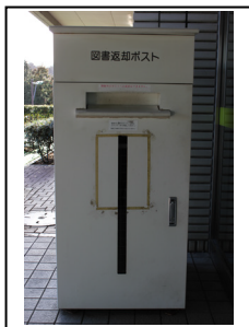
へんきやく ぽすと 返却ポスト