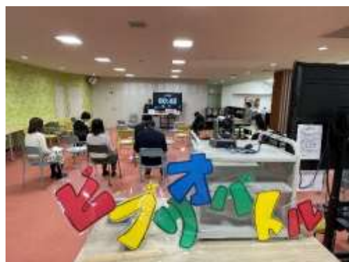
中・高・大学生で競う麗澤大学図書館ビブリオバトルの中高予選会の様子。

夏には中・高図書委員のイベント企画で『ジュラシックパーク』の上映会と、恐竜・進化・化石等関連本を展示。