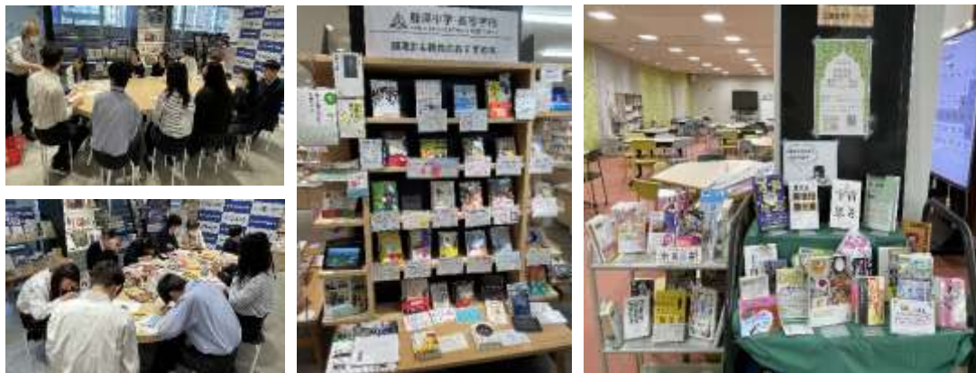
👉選書ツアー & POP 講習会・図書委員のおすすめ本 POP 展示(紀伊國屋書店 写真左・中)と、メディアセンターカウンター前でのおすすめ本 POP と本の展示(写真右)

図書委員(中学 30 人、高校 58 人)は、それぞれ無理なく活動できるよう、希望制で、昼休みまたは放課後のカウンター当番&返却本配架(書架整理)、イベント係(掲示・展示含む)、おすすめ本 POP 作成、本紹介 (HP 記事含む) などに分かれて活動しています。