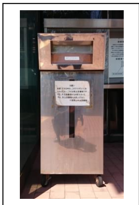
へんきやく ぼす と 返却 ポスト