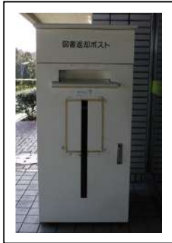
へんきやく ぽす と 返却ポスト