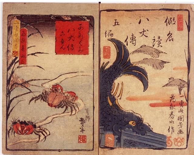
『仮名読八犬伝』為永春水(2代目)作、歌川国芳画ほか 〔菜の花ライブラリー〕千葉県デジタルアーカイブ