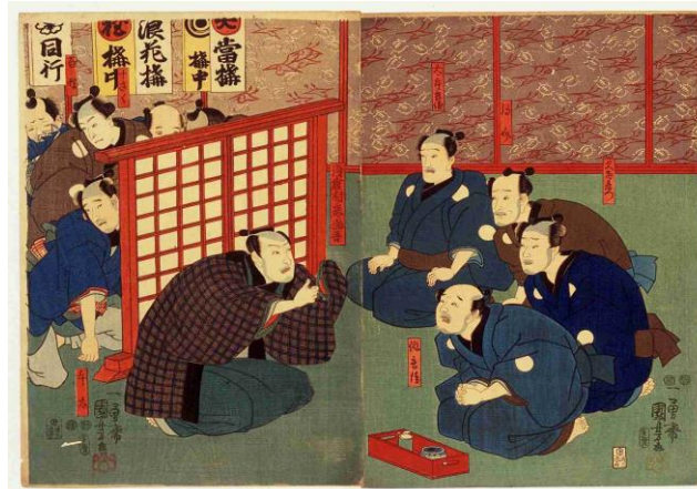
一勇斎国芳画『朝倉一代記 馬喰町旅籠屋の場』 (「菜の花ライブラリー」千葉県デジタルアーカイブ)