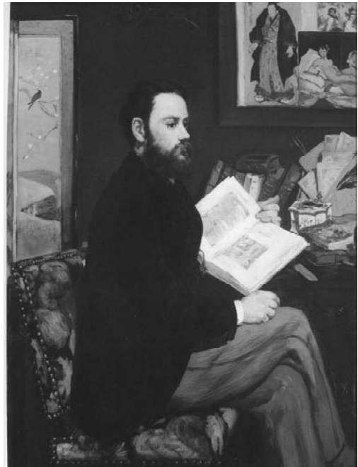
本を読む人シリーズ(30)