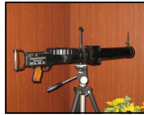
←珍しい機関銃型カメラ（イギリス軍使用のもの）

そのほか、大型湿板暗箱カメラやスプリングカメラ、二眼レフカメラ、隠し撮りなどに使うライター式カメラなど多種多様なカメラが見られます。