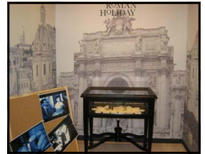
ローマの休日で使用されたライター式カメラ → と同機種のもの（展示室は壁面がローマ風になっています。）

また、卓郎氏と親交のあった山岳写真家「田淵行男氏」の愛用したカメラも展示されています。