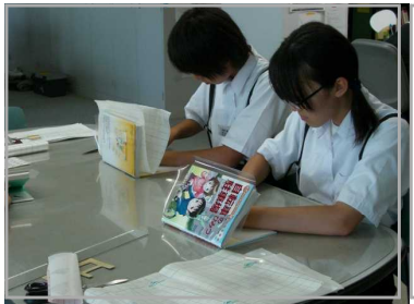
本の装備 ブックカバーかけ