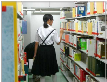
書庫での出納作業

東部図書館では、庶務・資料・調査・協力の4つの課に分かれて、それぞれが協力し合っ て仕事をしています。2日～3日の短い期間ですが、生徒の皆さんはそれぞれの課をまわっ て、図書館全体の仕事を体験しました。