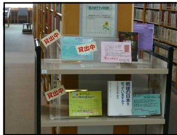
おすすめ本紹介コーナー 展示後1～2日で貸出されました。

カウンターで利用者への対応、書架の整理や資料の装備、市町村図書館への資料貸出など、意欲的に活動していました。「わたしのおすすめ本」のポップ作りや資料検索にも挑戦しました。