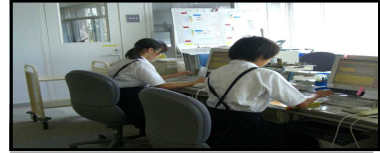
市町村図書館等への貸出作業

8月 3～ 5日 銚子市立第一中学校 6名 8月10～12日 銚子市立第二中学校 2名 銚子市立第六中学校 2名 銚子市立第七中学校 1名 8月17～18日 旭市立第一中学校 5名 8月24～26日 旭市立海上中学校 3名 旭市立干潟中学校 3名