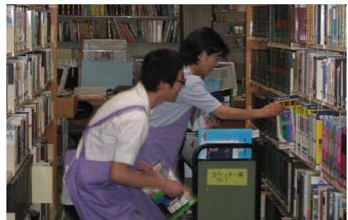
ボランティア活動の様子

西部図書館では、3月にボランティア養成講座を実施しましたが、受講修了者のうち、2名の方が、本年度ボランティアとして活動を開始しました。書架整理などを中心に図書館業務のお手伝いをして頂いています。