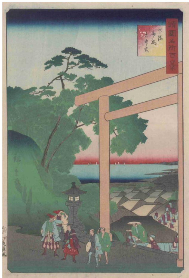
(菜の花ライブラリー『諸国名所百景』より)