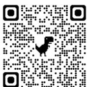
千葉県立図書館公式 X