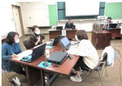
ディスカッションの様子