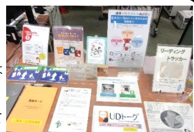
読書バリアフリー相談窓口

こちらでは、拡大読書器や対話支援機器、リーディングトラッカー等読書を支援するツールを利用できるほか、県立図書館が取り組んでいる障害者サービスについて案内しています。