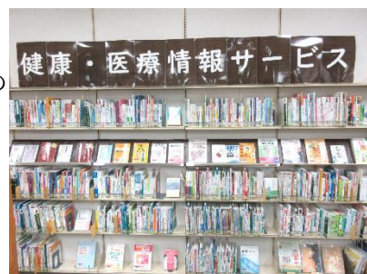
健康・医療情報サービスコーナー

病気や薬、健康管理など様々な役立つ情報を提供するほか、ミニ展示コーナーもあります。医師や医療機関と相談する際の材料として、ぜひご活用ください。