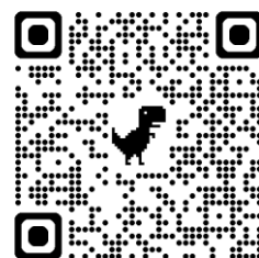
展示「千葉県北西部の100年」のお知らせ