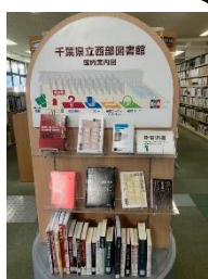
新着図書コーナー

公式 X では、ほかにも本の紹介やイベントの告知などを行っていますのでご活用ください。